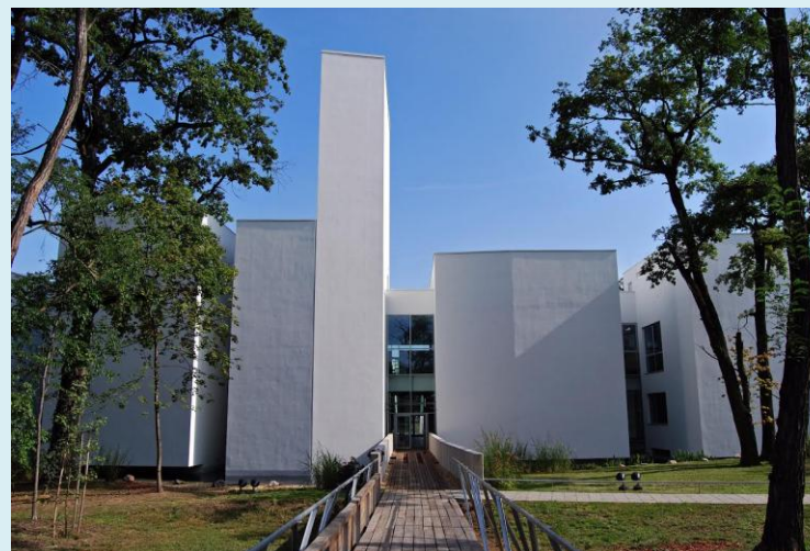
Agóra Tudományos Élményközpont